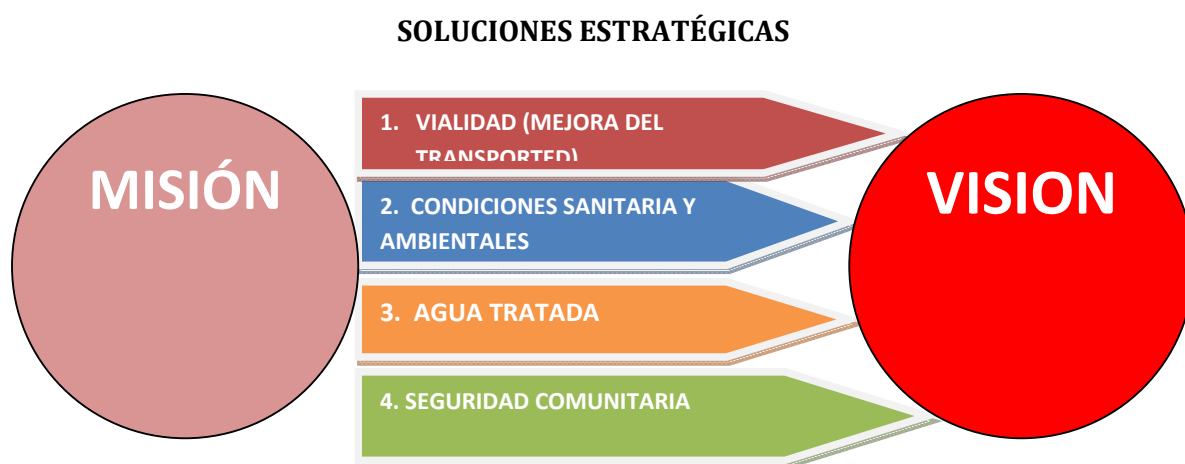
Diagrama de soluciones comunitarias

Elaboración: Equipo Técnico INDITEQ Cía. Ltda.