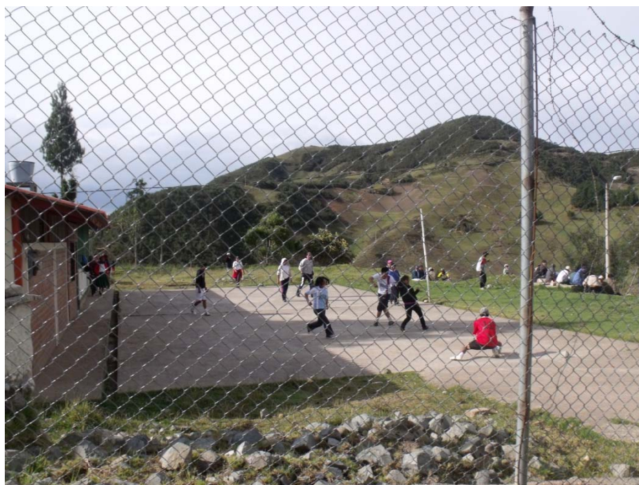
GULAGPUGRO - TARQUI - AZUAY 2011