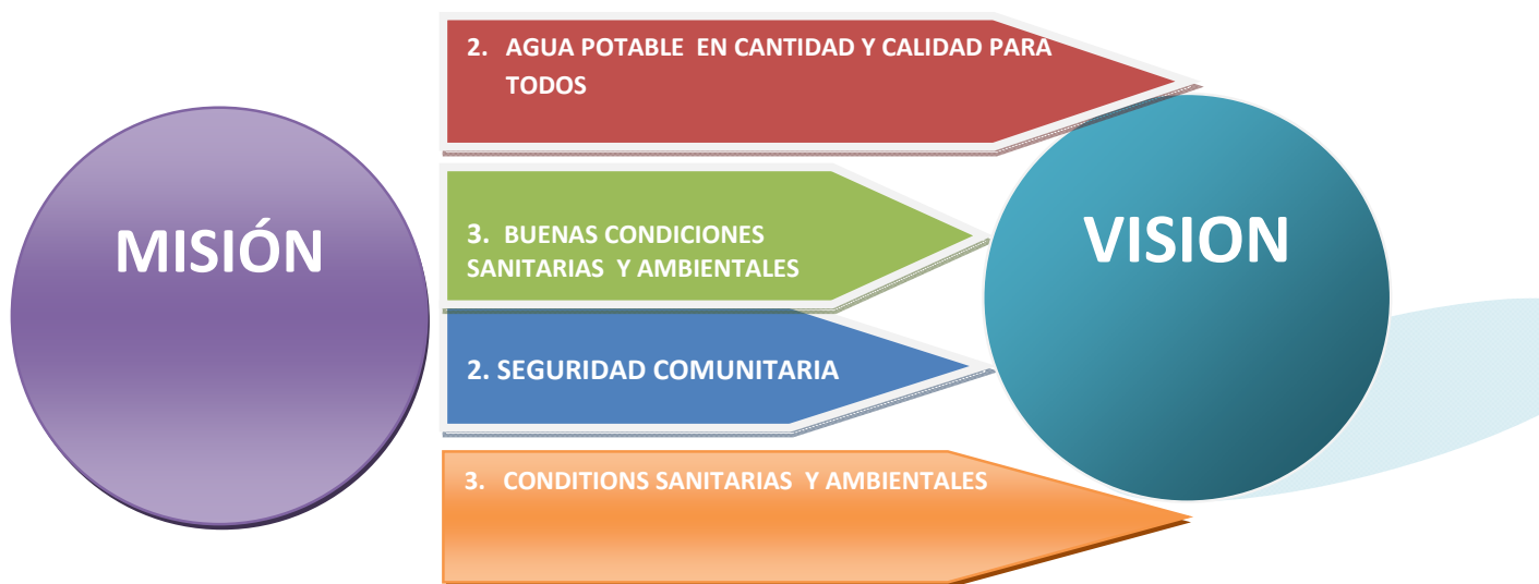
Diagrama de soluciones comunitarias SOLUCIONES ESTRATÉGICAS