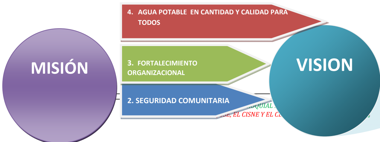
Diagrama de soluciones comunitarias SOLUCIONES ESTRATÉGICAS

Somos un barrio organizado, con servicios de agua potable para todos, con un sistema de saneamiento ambiental óptimo, con redes de alcantarillado, con viviendas dignas, que mediante la unión y trabajo coordinado mediante las mingas comunitarias, el apoyo de la Junta Parroquial de Tarqui, la Municipalidad de Cuenca, junto con Etapa; el apoyo del MIDUVI y otras instituciones públicas correspondientes mejoramos nuestras malas condiciones del hábitat, saludables, sanitarias, educativas y organizacionales.