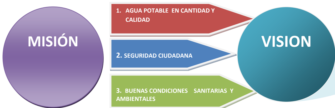
Diagrama de soluciones comunitarias SOLUCIONES ESTRATÉGICAS

Elaborar el proyecto y solicitar el financiamiento a ETAPA – EP, para el agua potable, trabajar unidos toda la comunidad, en el tema de la seguridad con las autoridades coordinar con el teniente político, formar conjuntamente con Junta Parroquial de Tarquí y la comunidad una brigada barrial, con la colaboración de las instituciones del Estado correspondientes. Para el mejorar las condiciones sanitarias ambientales trabajar con la colaboración de la ETAPA-EP, EMAC-EP y otras instituciones.